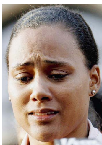
MENTEUSE La justice américaine n'a pas fait de cadeaux à Marion Jones.

L'ex-star des Jeux de Sydney devra en outre accomplir 400 heures de travail d'intérêt gé-