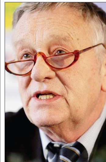
SEREIN Gian Franco Kasper est confiant à une année des Mondiaux.

Gian Franco Kasper, le président de Fédération internationale (FIS), estime que la «crise» autour de l'organisation des Mondiaux 2009 à Val d'Isère est «terminée». Le secrétaire d'Etat aux Sports français Bernard Laporte juge pour sa part que tout est «rentré dans l'ordre».